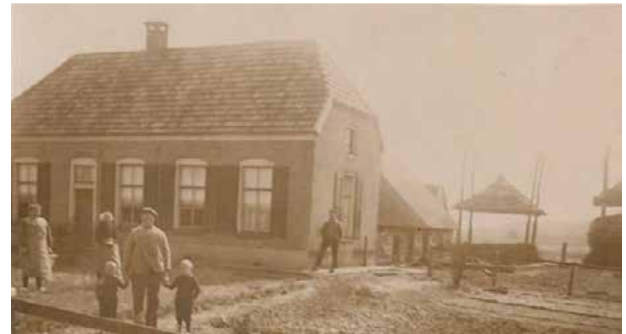
Boerderij "De Veldwachter"

Voor info: Tel. 0611361116 Mail. robstrijdveendienstverlening@hotmail.com